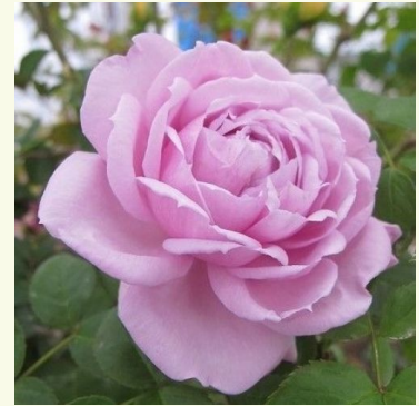
Le Ciel Bleu

malven-lila - nostalgierose 45-65 cm mittelstark duftende, gut wahrnehmbare rose - angenehm süß Biljana Božanić Tanjga