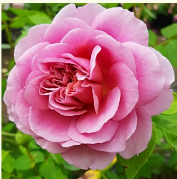
Robe à la française

rosa - nostalgie-rose 70-110 cm stark duftende, gut wahrnehmbare rose - süß, fruchtig PhenoGeno Roses