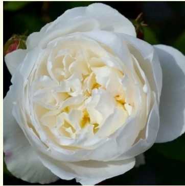
White Mary Rose™

rosa - nostalgie-rose 120-190 cm stark duftende, gut wahrnehmbare rose - frisch, fruchtig John Scarman