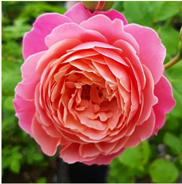
Prix P. J. Redouté