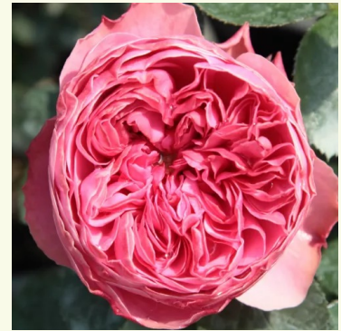
Leonardo da Vinci®