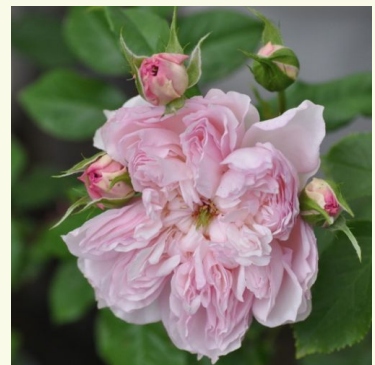
Cecil de Volanges

gold-gelb - nostalgie-rose 80-110 cm sehr schwach, kaum wahrnehmbar duftende rose - diskret, fein im charakter Dominique Massad